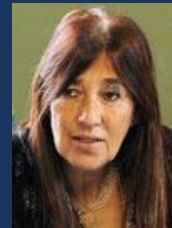
Sen. Edda Evangelina Acuña